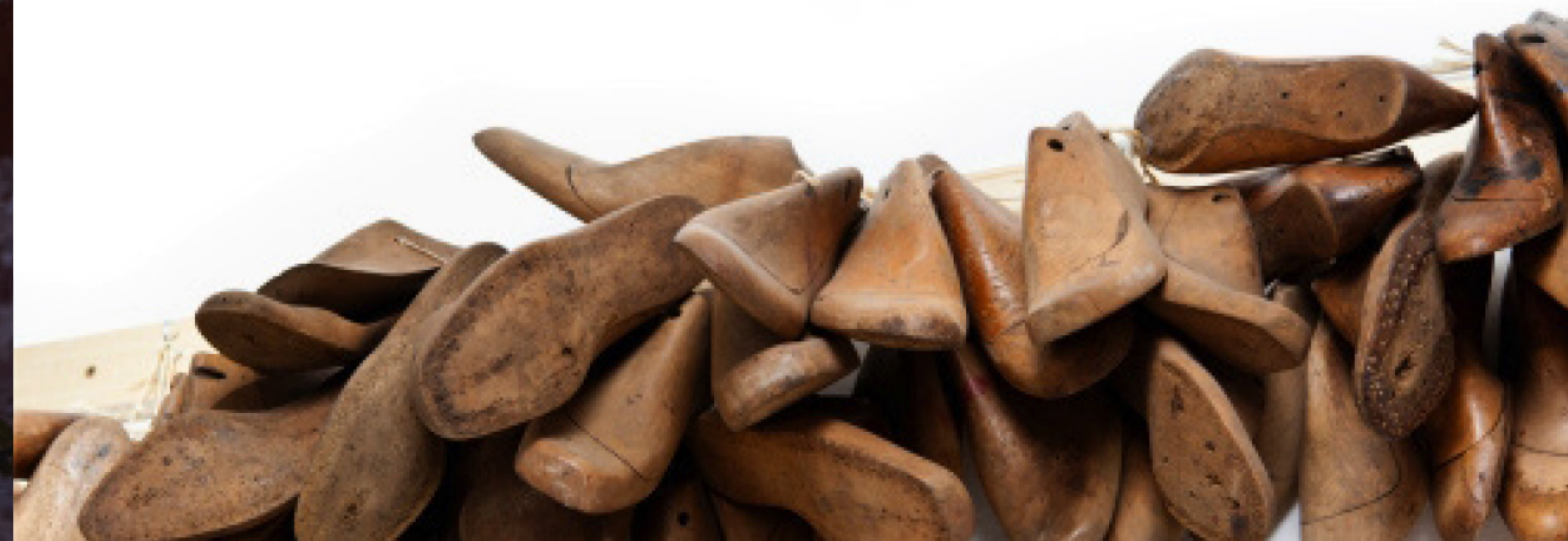
Illustration by Angelo Dallari