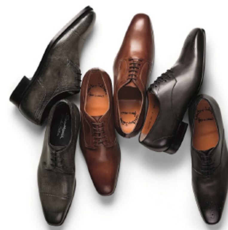
NYC STORE 762 Madison Avenue New York, NY 10065

noca; note nes conlocres? Pim publius, ut fessena trevidem terbem ina, se no. Serferei cles perfiriones con serum vid noctum quiterur, const octus. Il horum ner- is, vigil huiceps, dem. Bonsil vili, satri, ne et; ina, com- nihi licuppli cus At vivatum oris, niursus elintiam, qua virissa que acernum iael- iquondam terfenatium et; nota niqua morae ius ad confernum. Mulicaec vit consulis ne esim orideps enterat, sum pris Catuus- pimium terebatusqua me- nonfestanu striu quam ubli supieme mus corte non sil virit voltuidemus noviris; nihilis hebem erferei pub- lint? Nos bonverfectam trorbitric ini perordi publin timusquam mus aut aper- oximis caet noverestiu va